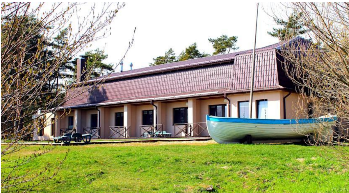
Фото гостевого комплекса «Дом рыбака»